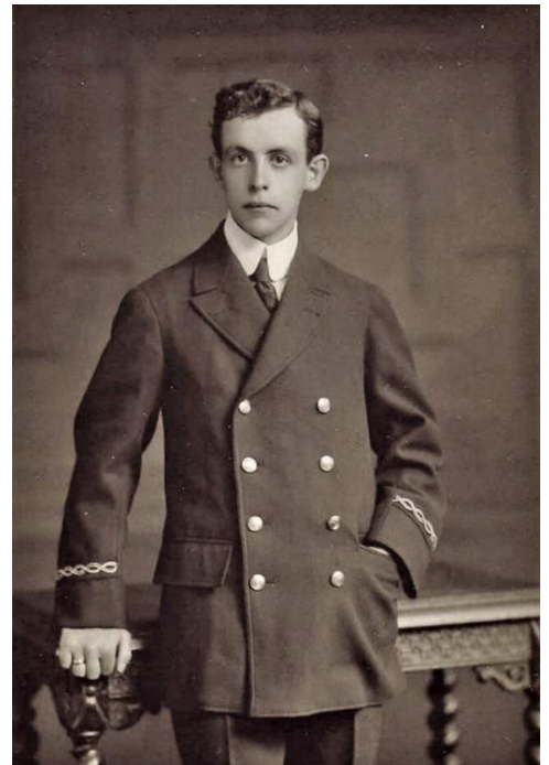
Harold Bride, zweiter Funker der Marconi-Station auf der Titanic

Nach endlosen Arbeitstagen, in denen sie Hunderte von „Marconigrammen“ versendeten – so wurden die von den Marconi-Sendern verschickten Telegramme genannt –, stand den Funkern ein kleiner Raum neben dem Funkraum zur Verfügung, der mit Etagenbetten, einem Schrank und einem Waschbecken ausgestattet war, damit sie sich in unmittelbarer Nähe ihres Arbeitsplatzes ausruhen konnten.