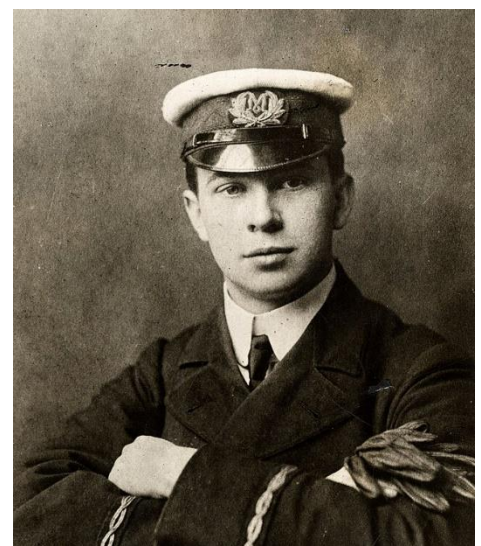
Jack Phillips, Leiter der Funkstation auf der Titanic.

Am selben Tag, dem 12., tritt am Abend ein Problem auf. Ein Defekt macht die Funkstation unbrauchbar. Phillips und Bride ignorieren die Anweisungen von Marconi und versuchen, den Fehler zu lokalisieren, den sie erst viele Stunden später finden werden.