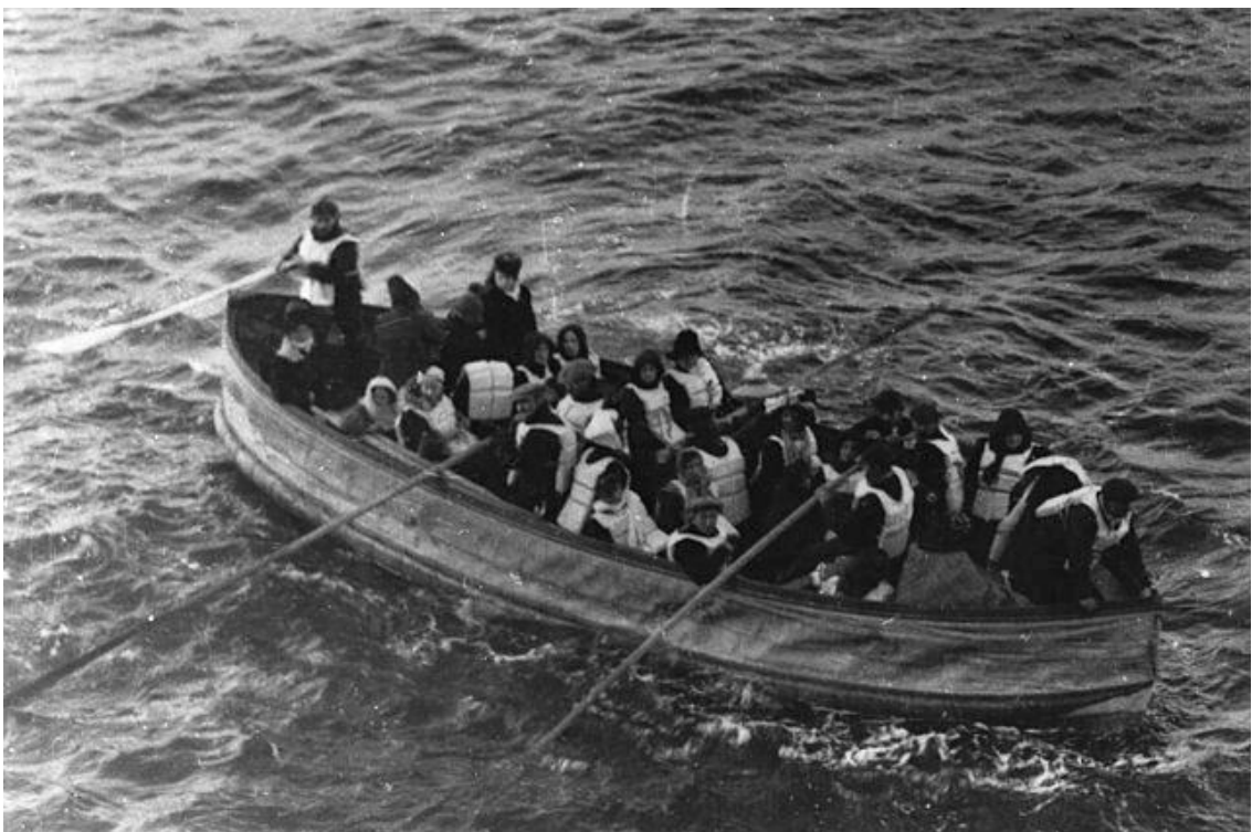
Passagiere aus dem letzten Rettungsboot der Titanic, das von der Carpathia gefunden wurde.

Im Marconi-Raum stand bereits Wasser, es war das Ende. Genau um 02:17 Uhr gaben die Generatoren den Geist auf und die Titanic verstummte.